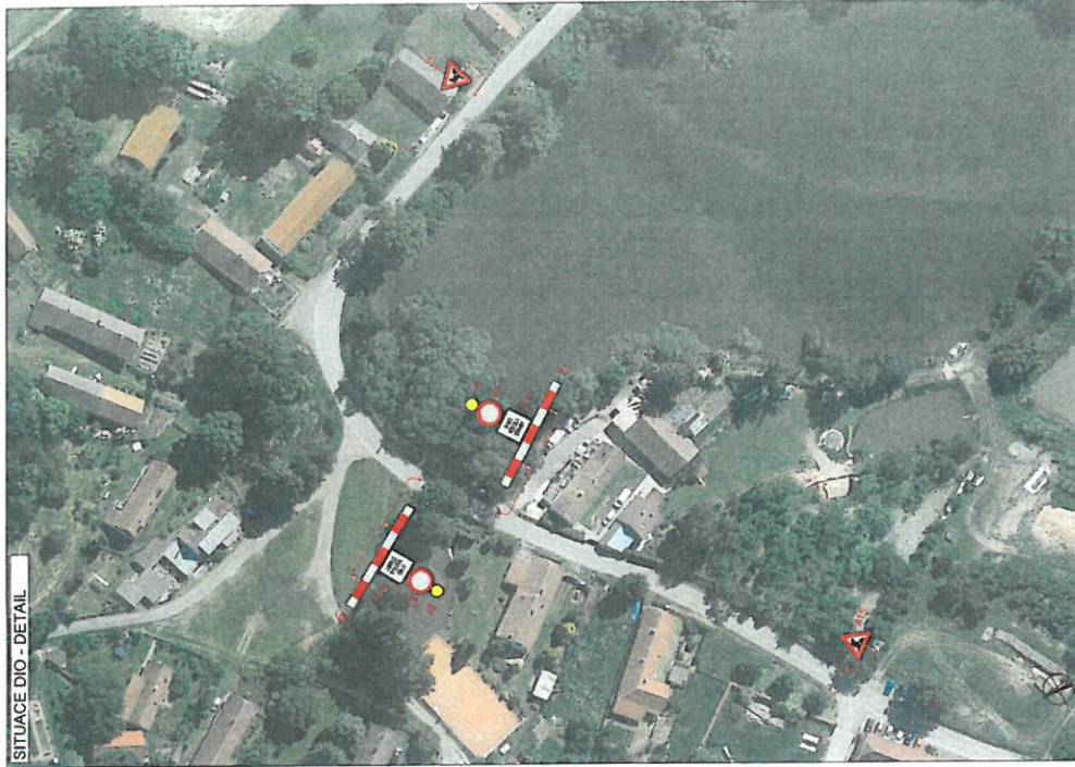
SITUACE DIO - DETAIL